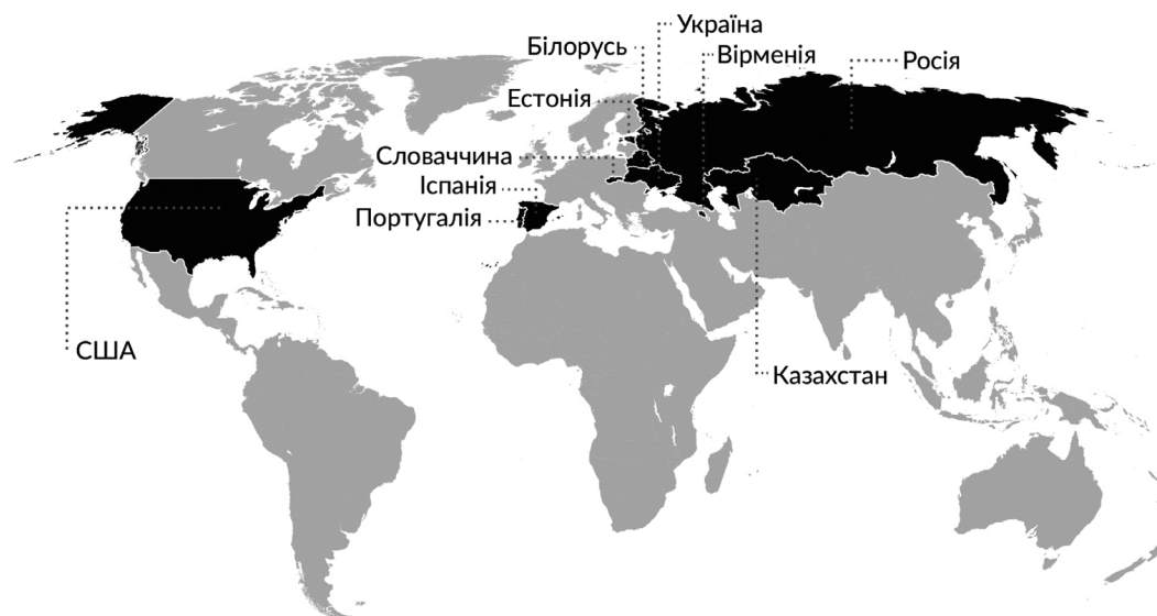
Рис.1. Країни, учасники з яких взяли участь у заходах ГІС-форумів у 2012-17 рр.