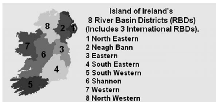
Рис.3. Басейни річок Ірландії (карта зі стратегії сталого розвитку Ірландії)

Парадоксально, але незважаючи на високу якість ілюстративних матеріалів, що спостерігається у багатьох національних стратегіях країн Європи, для них характерний дуже низький рівень або навіть повна відсутність картографічного забезпечення. Картографічні твори представлені лише у стратегіях таких країн, як Ісландія, Ірландія, Латвія, Іспанія та Велика Британія, проте кількість карт незначна: від однієї до шести.