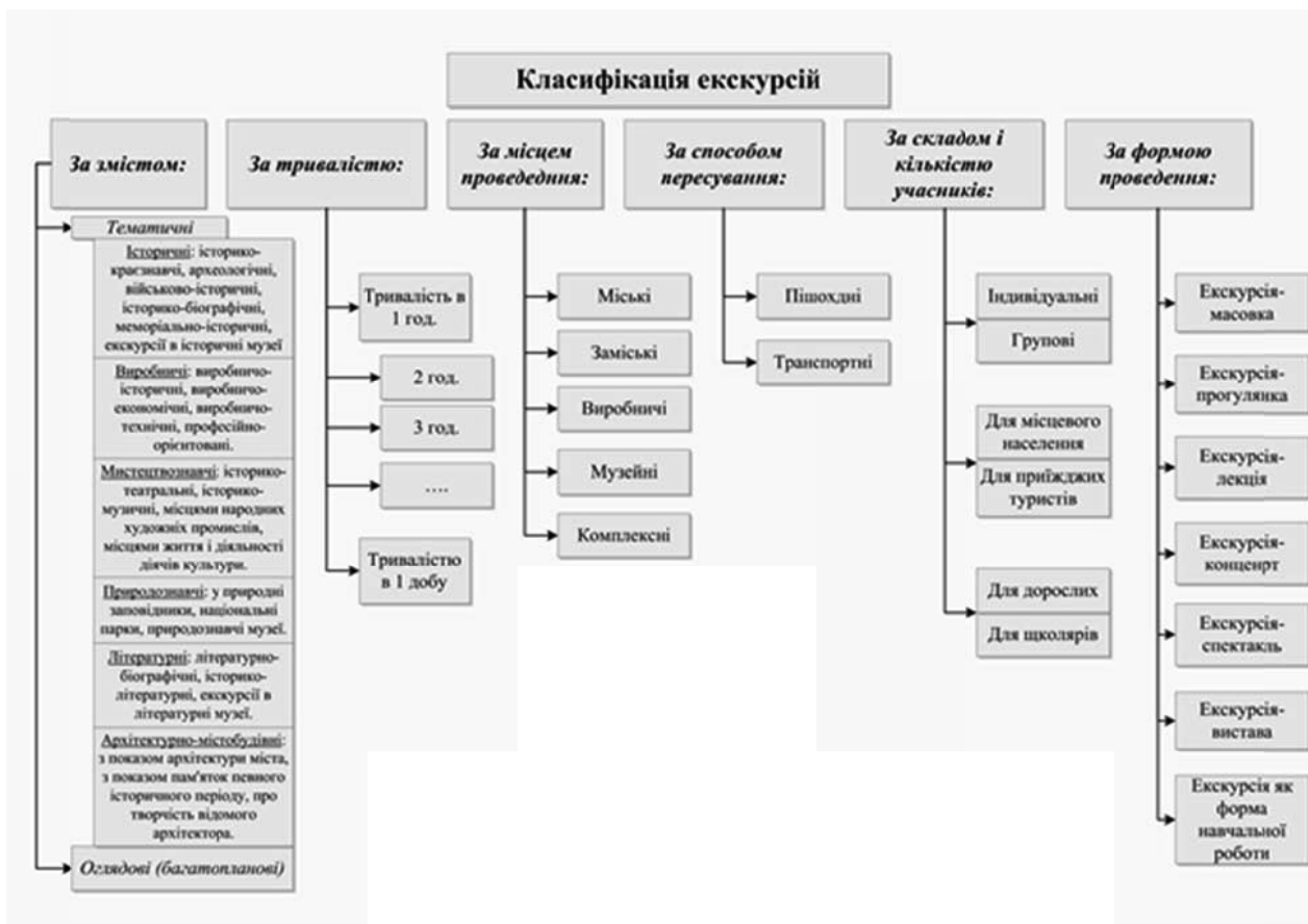
Рис.2. Класифікація екскурсій за різними ознаками (побудовано авторами за даними [3])

За своєю природою екскурсія є багатограним явищем. Вона об'єднує інформацію екскурсовода, враховуючи при цьому методику подачі інформації (професійну майстерність), об'єкти показу як окремі складові екскурсійної діяльності в широкому розумінні, транзитне забезпечення і т. ін. Поряд з поняттям «екскурсознавство» нерідко вживають й інші - «екскурсологія», «екскурсійна справа», «екскурсійна діяльність». На перший погляд, усі ці терміни і пов'язані з ними поняття ідентичні за суттю, є різними дефініціями одного й того ж. Однак це поверхове ототожнення. Екскурсознавство – найзагальніше поняття, яке охоплює будь-яке знання про екскурсію – загальне і часткове, теоретичне і практичне, абстрактне і конкретне.