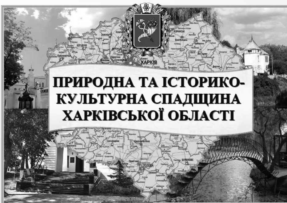
Рис. 1. Титульний аркуш атласу «Природна та історико-культурна спадщина Харківської області»